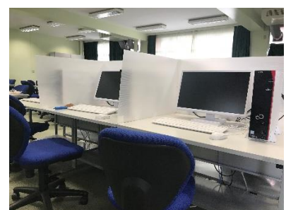
コンピュータ教室